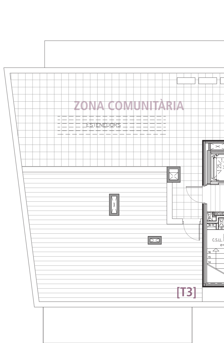
PLANTA COBERTA ESCALA GRÀFICA 1/100