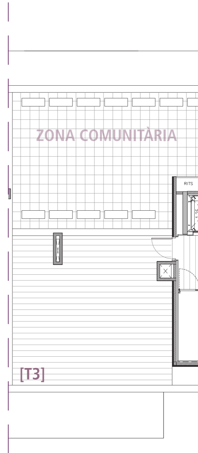
PLANTA COBERTA ESCALA GRÀFICA 1/100